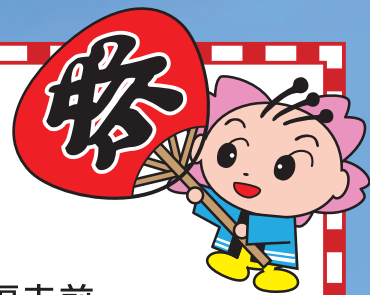
幸手市のマスコット「さっちゃん」